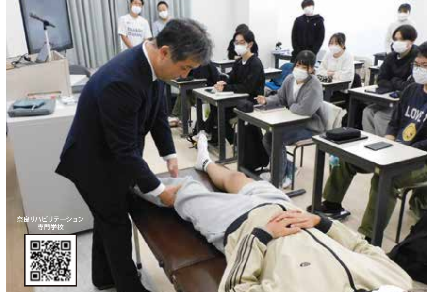
奈良リハビリテーション専門学校