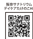
阪奈サナトリウム デイケアたけのこHP

デイケアについてのお問合せ TEL 0743-78-1188 (受付時間: 月～金曜日9～17:00)