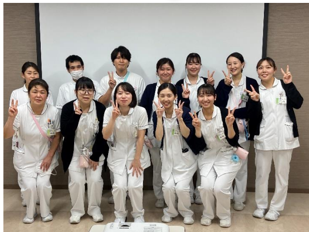
今日が新人として最後の研修です みなさんととても良い笑顔です