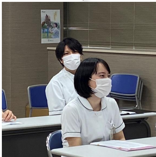
2年目に向かっての目標 かっこつけずにありのまま